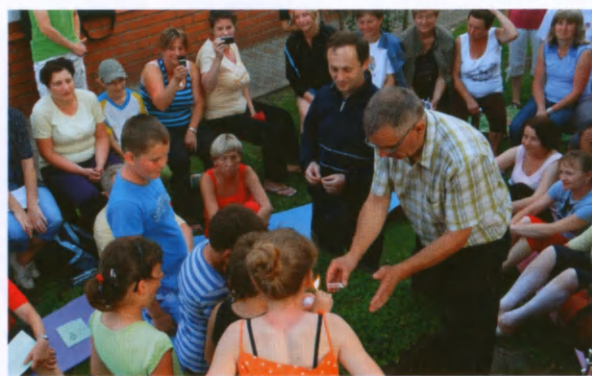
Rytuał zapalania ogniska