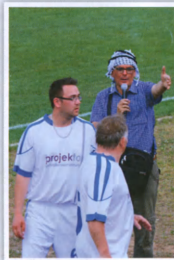
Niektórych tak rozbolała głowa, że używali specjalnych chust antystresowych...

Cieszymy się, że wszystko się udało. Byliśmy przez te dwa dni jedną wielką Rodziną! I o to głównie chodziło. Może uda nam się z tej braterskiej atmosfery festynowej przenieść coś na dalsze tygodnie i miesiące? Wierzę, że tak będzie, już tak jest. Na zdjęciach obok, kilka wspomnień z tych wspaniałych majowych dni w Sławięcicach. Czy w roku 2014 znowu się skrzyknijemy i znowu zorganizujemy festyn? G. Kurzaj