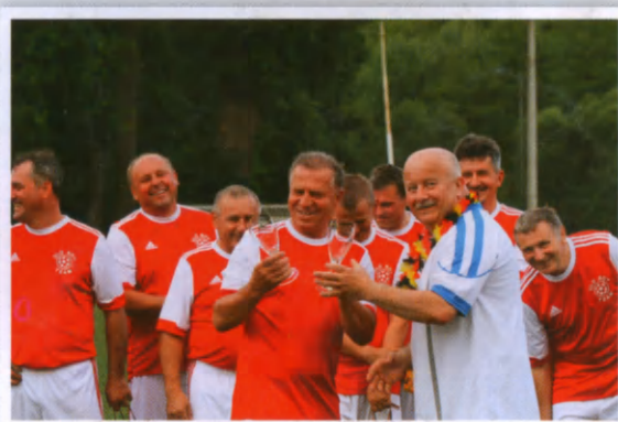
Chłopcy po co Wam to szkło?