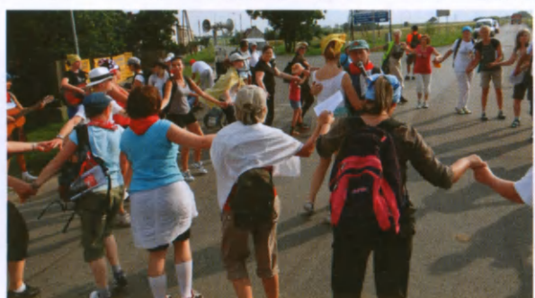
I jeszcze walczyk, na 33 kilometrze