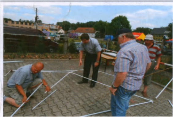
Ksiądz Proboszcz miał wszystko pod kontrolą.