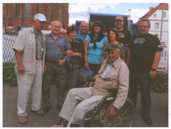
Ekipa radia HAJER gościła w Sławięcicach.