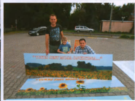
Pomagali starsi, młodszy i najmłodszy..

Co to były za dni! Piękne, radosne.... Ilu gości z różnych stron Polski i Europy. Prawie 6 miesięcy przygotowań. Zaangażowani wolontariusze ze wszystkich ulic osiedla.