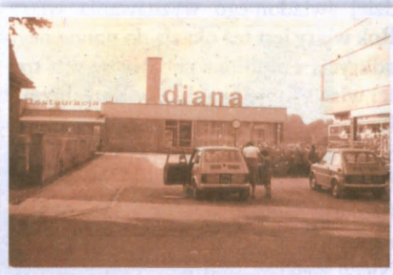
Restauracja DIANA dawniej...