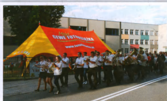
Nasza niezawodna sławięcicka orkiestra