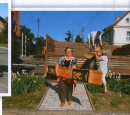
Co to dla mnie przenieść ławki gdy jutro jest festyn.