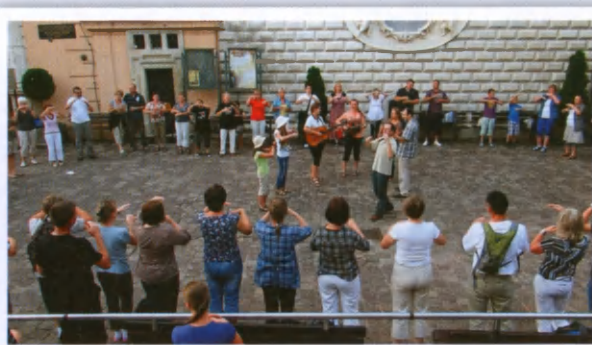
Bawią się i starsi i młodszy.