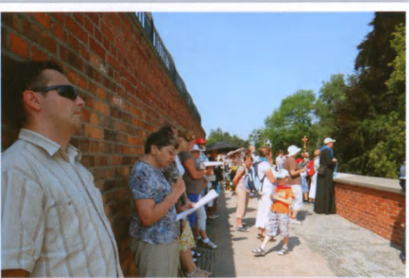
W spiekocie dnia-Droga Krzyżowa.