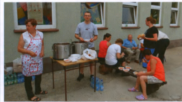
Starsi pielgrzymi nas dożywiali...