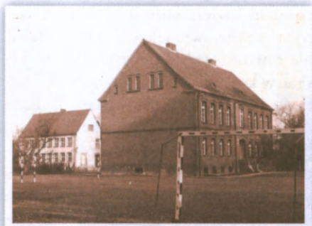
Ach „ta nasza stara szkoła”!