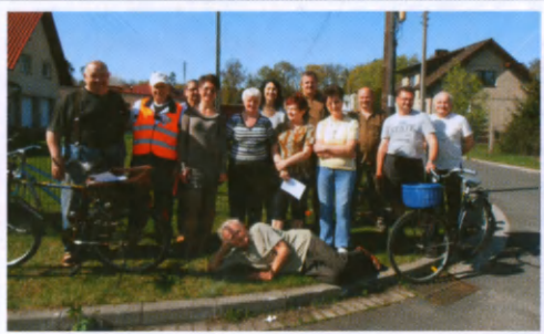
Spotkania organizacyjne na poszczególnych ulicach przed festynem.

Nad wszystkim czuwała nasza Patronka Św. Katarzyna