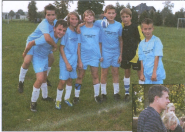
Oto przyszli uczestnicy mistrzostw świata...

Sport to nie tylko bieganie za piłką. Czasem są chwile na coś słodkiego.