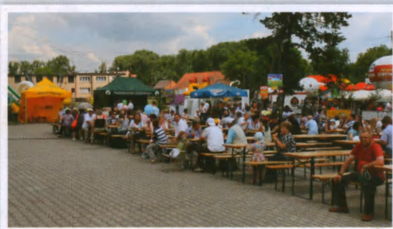
Najpierw trochę pojedliśmy, a potem były tańce..