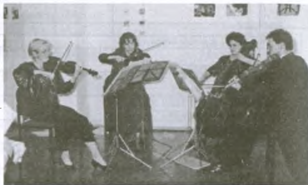
Opolski kwartet smyczkowy podobał się wszystkim