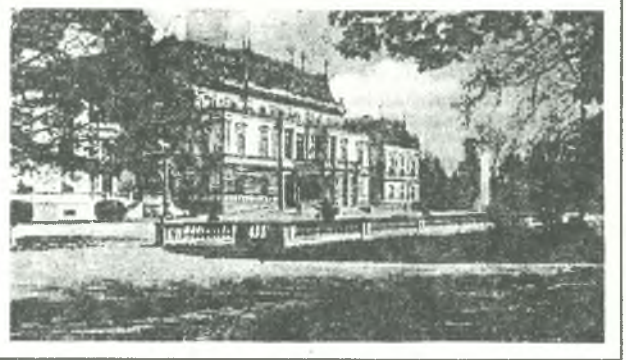
Pałac książąt Hohenthohe w Sławięcicach około 1918 r. Ilustracja: Karol Jonca: Dzieje społeczno-gospodarcze Sławięcice (do 1944 r.) w: Ziemia Kozielska t. III

dokonano w nim wiele zmian i przekształceń. Na terenie całego parku pozostały ślady dawnej kompozycji, zachowały się niektóre budowle parkowe lub ich pozostałości.