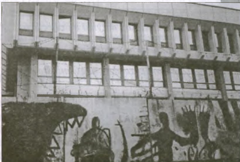
Wilno. Budynek litewskiego parlamentu na pierwszym planie pozostałości barykady okalającej parlament w 1990r. Barykada miała chronić Sejm przed przewidywanym atakiem wojsk radzieckich.