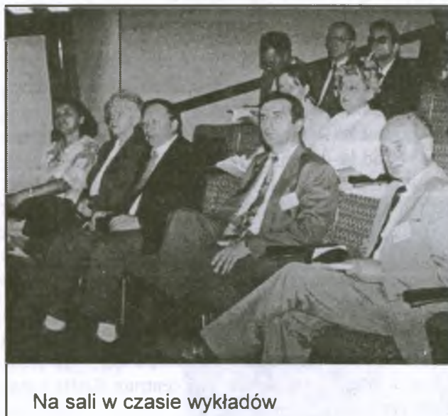
Na sali w czasie wykładów