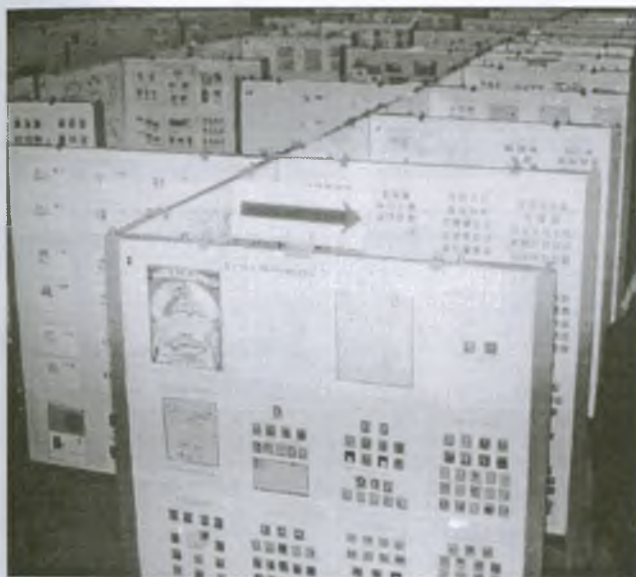
Tak wyglądała ekspozycja znaczków na Wystawie Filatelistycznej