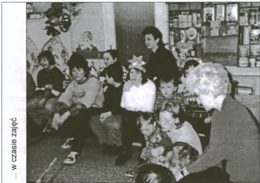
... w czasie zajęć

Nie wszyscy na co dzień uświadamiamy sobie, że wśród nas żyją ludzie, którzy wymagają szczególnej troski. Często stykamy się z osobami, których zachowanie jest nieco odmienne, czasem zaskakujące.