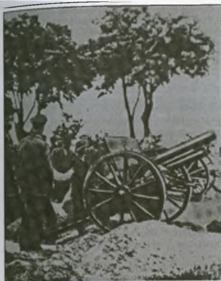
BATERIA ARTYLERII POWSTAŃCZEJ POD SŁAWIĘCAMI

Sam Kędzierzyn przejściowo został opanowany przez powstańców już 3 maja 1921 r. W następnych dniach Niemcy zgromadzili do jego obrony około 3500 ludzi. Siły powstańcze zbliżyły się do 4 tysięcy. Po zajęciu w dniu 4 czerwca 1921 r. Sławięcic, Blachowni Śląskiej, Raszowej i Januszkowice powstańcy rozpoczęli kilkudniowe walki o Kędzierzyn. Zakończyły się one 9 maja 1921 r. zdobyciem w godzinach porannych dworca kędzierzyńskiego - bronionego przez żołnierzy włoskich - a wieczorem całej miejscowości. W bitwie kędzierzyńskiej Niemcy stracili około 200 zabitych i rannych, a Polacy 39 zabitych i 211 rannych. Zdobycie Kędzierzyna otwarło powstańcom drogę do portu kozielskiego. Przystań Koziełska została zdobyta po wielogodzinnych ciężkich walkach wieczorem 10 maja 1921 r. Na wyzwolonych przez powstańców terenach utworzone zostały lokalne ogniwa administracji. Przetrwały one do początków czerwca 1921 r.