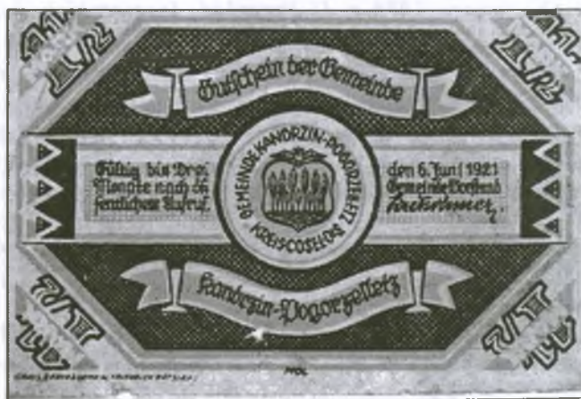
Pieniądz zastępczy wydany przez gminę Kędzierzyn-Pogorzelec 9.06.1921r.